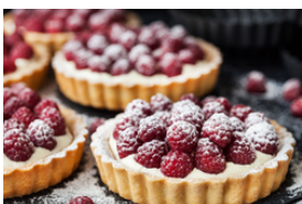
Desserts und Früchte