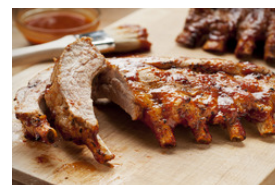
Schwein mit hellen Saucen