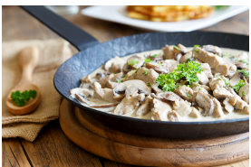
Veal in a light sauce